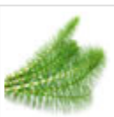
Cola de caballo