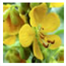
Pico de pájaro